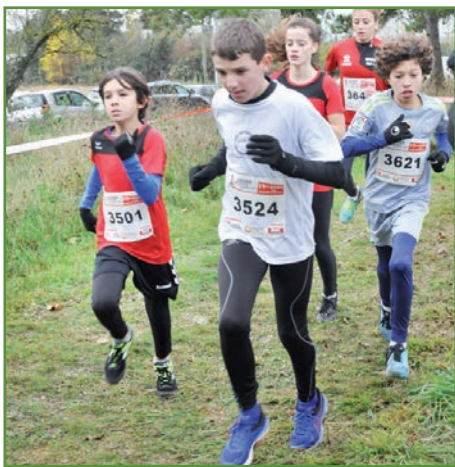
Jeunes et moins jeunes, garçons et filles, athlètes de haut niveau et coureurs du dimanche ont profité d'une organisation sans faille.

Une fois encore le cross de l'Yonne Républicaine a été à la hauteur de sa réputation. Dimanche 19 novembre aux abords de la maison de quartier des Piedalloues des centaines de marcheurs ont rejoint le gros du peloton des coureurs.