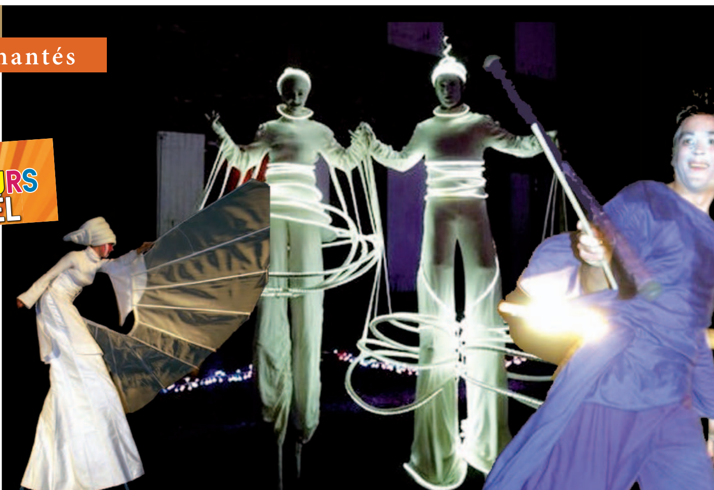
De nombreuses animations nouvelles basées sur la puissance évocatrice d'images projetées sur les murs et les bâtiments habiteront avec des rendez-vous populaires ( Corrida, Noël enchanté... ) qui ont fidélisé leur public depuis plusieurs années.