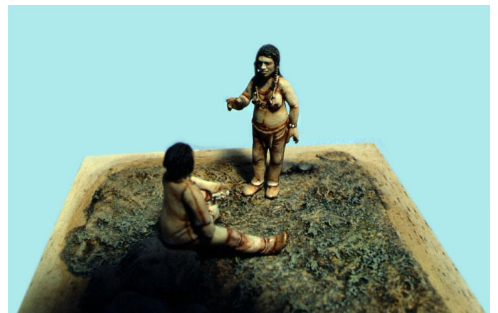
Maquette – Chasseurs gravettiens sculptant une Vénus en ivoire de mammouth Maquette et photo Patrick Guéneau

Cette section présente rapidement quelques exemples, des Vénus préhistoriques en ivoire de mammouth (représentées ici par des moulages) aux peignes de corne en passant par un bois de renne utilisé comme percuteur par des habitants préhistoriques d'Arcy.