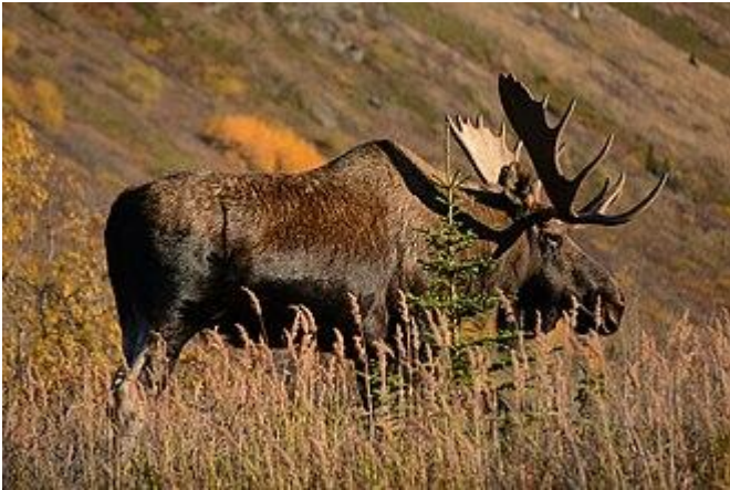
Elan du Canada Alces alces