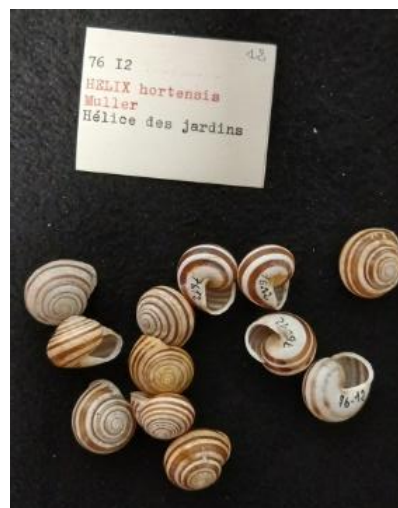
Coquilles d'escargots des jardins

Fragile et mal connue, cette collection fera bientôt l'objet d'un récolement (inventaire complet) pour mieux connaître les richesses de ce fonds, des coquillages marins exotiques aux nombreuses espèces d'escargots terrestres.