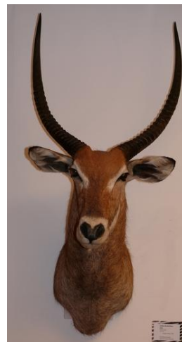
Cobe de Buffon Kobus kob

Certaines de ces pièces seront présentées dans l'exposition Drôles de têtes !