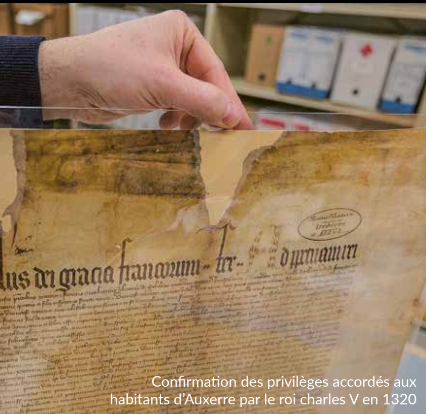
Confirmation des privilèges accordés aux habitants d'Auxerre par le roi Charles V en 1320

2km de linéaires retracent les neuf siècles d'histoire de la ville au sein des Archives municipales hébergées à l'Hôtel de Ville, issues de l'activité des services publics (état-civil, élections, recensement, enfance) de la commune depuis le XII e siècle. Parmi ces documents, on retrouve le corpus des chartes d'affranchissement des habitants d'Auxerre ainsi que des archives privées (fonds Paul Bert, fonds de l'Amicale des anciens Guilliet, etc.). Consultation sur rendez-vous aux jours et heures ouvrables et sur le portail numérique https://archives.auxerre.fr .