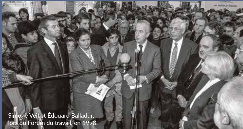
Simoné Veil et Édouard Balladur, lors du Forum du travail, en 1998.