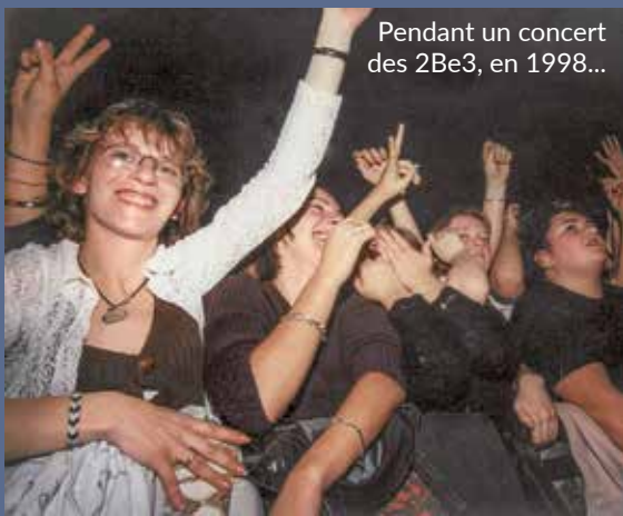
Pendant un concert des 2Be3, en 1998...

« Aujourd'hui Auxerrexpo, c'est une soixantaine d'événements et plus de 200000 visiteurs par an. On organise aussi bien des salons professionnels que grand public, des dîners de galas, des congrès ou des assemblées générales. Mais aussi de nombreux concerts, spectacles, pièces de théâtre ou événements de loisirs. Mais il nous manquait de petits espaces modulables pour nous adapter au marché des séminaires, congrès et conventions d'entreprises, qui nécessitent des espaces plus petits et surtout dotés des dernières technologies. Avec ce nouvel équipement, nous visons l'organisation de 100 d'événements dès 2026. »