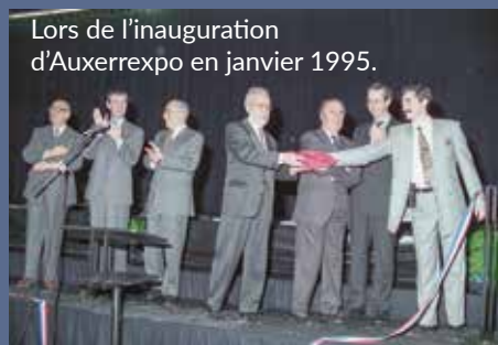
Lors de l'inauguration d'Auxerrexpo en janvier 1995.