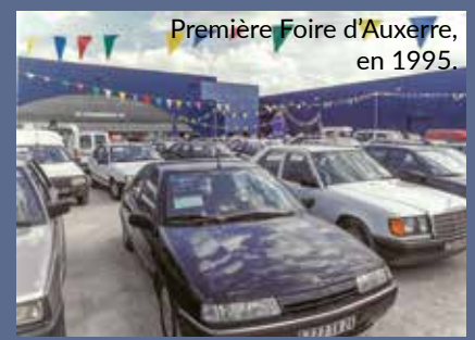
Première Foire d'Auxerre, en 1995.