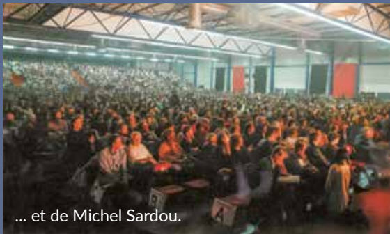
... et de Michel Sardou.