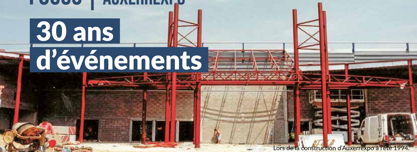
Lors de la construction d'Auxerreexpo à l'été 1994.