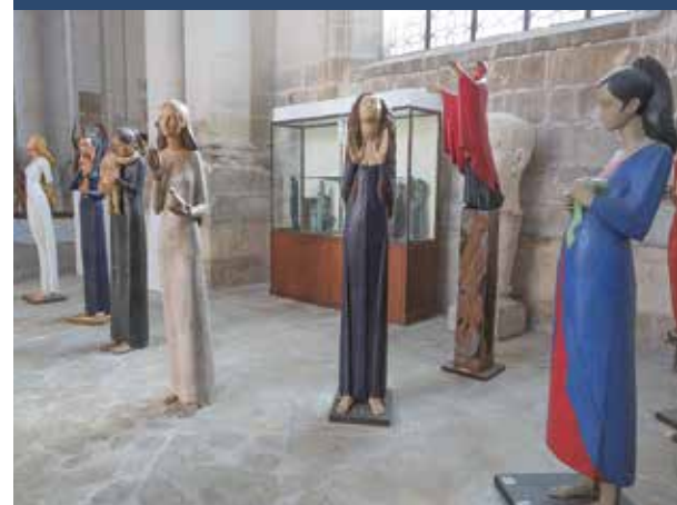
© Exposition des sculptures de François Brochet, à la Chapelle des Visitandines, Auxerre.

Le 1 er février, une élève de la classe, sa maman et l'enseignante ont été reçues aux Invalides pour la remise du prix (photo). La journée s'est prolongée avec une visite du musée de l'Armée, avant le ravivage de la flamme de la tombe du Soldat inconnu sous l'Arc de triomphe. |