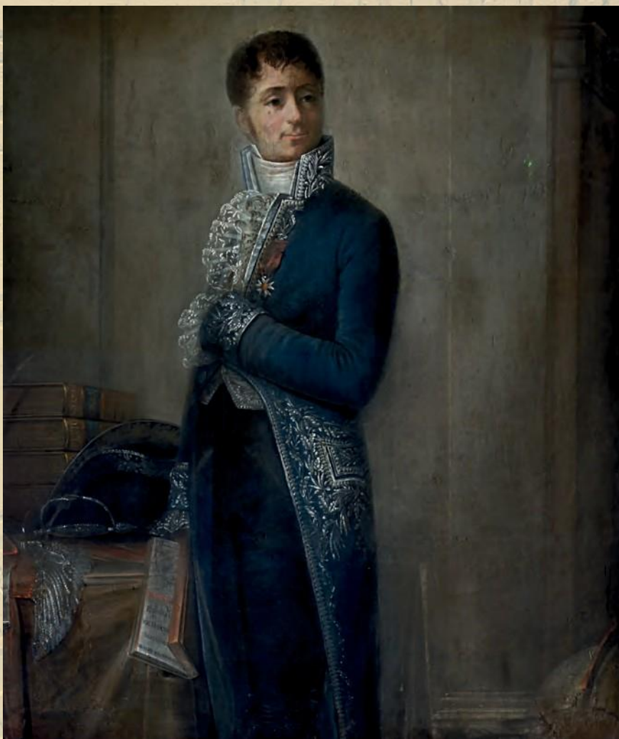
Le baron joseph fourier, XIXième siècle