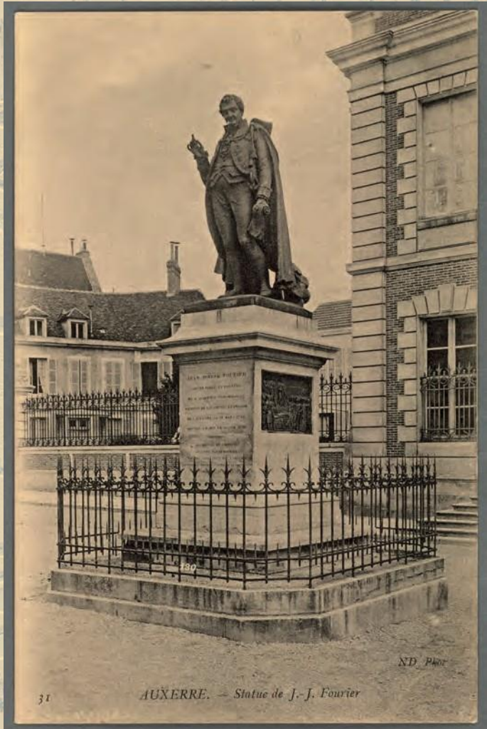
Sculpture par Edme Faillot

Malheureusement, elle a été déplacée plusieurs fois avant d'être fondue pendant la Seconde Guerre mondiale et fait maintenant partie du patrimoine perdu de la ville d'Auxerre.